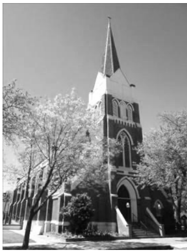
St. Joseph' Mission